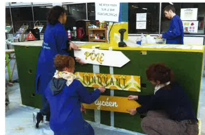
Des résidences d'artistes, des partenariats et des évènements tout au long de l'année.