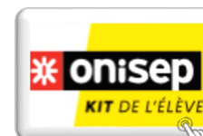
Kit ONISEP de l'élève