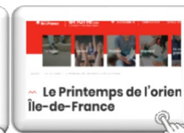
Le printemps de l'orien Île-de-France