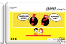
Mon printemps personnalisé