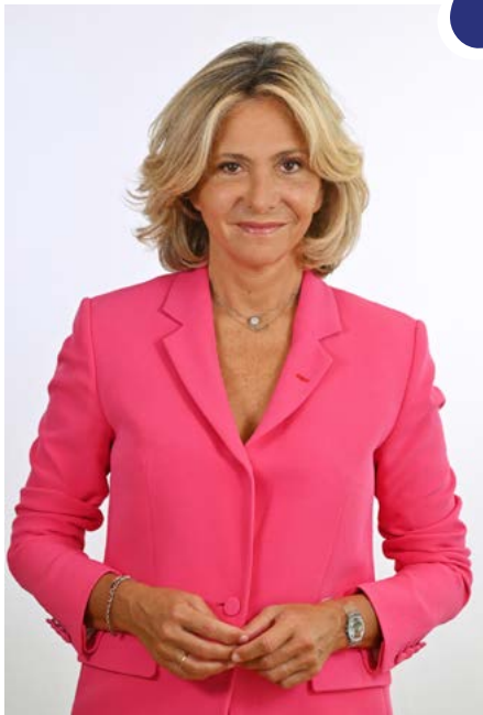
Valérie PECRESSE Présidente de la Région Île-de-France